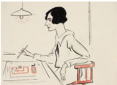
Foto: Architektin Margarete Schütte-Lihotzky, gezeichnet von Lino Salini, © Historisches Museum Frankfurt (C29894)